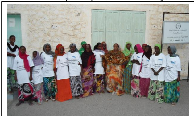
Distribution des t-shirts à Randa

Les autres allocations étaient modestes, mais il faut attirer l'attention sur les 11% des fonds dépensés sur les « outils de plaidoyer » mal conçus. La brochure est beaucoup trop chargée et n'existe qu'en français ; il est difficile de savoir comment il allait être utilisé. Les t-shirts ne font pas partie de l'habit normal de la population cible et ne porte pas, de toute façon, des messages outre le titre du projet. Les affiches et les panneaux sont discutés plus bas (voir page 18) et portent les messages parfois discriminatoires. Cet argent aurait pu être utilisé ailleurs, par exemple pour le meilleur équipement et même de modestes honoraires pour les bénévoles.